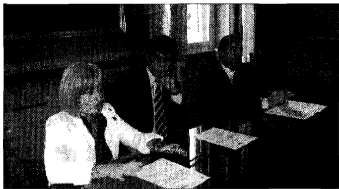
L'iniziativa Per l'inserimento in azienda

PERUGIA - Inserire gli studenti nel mondo del lavoro creando un ponte tra le aziende e gli istituti scolastici. Questo è l'obiettivo della convenzione-quadro tra Confindustria, Provincia ed istituto tecnico industriale «A. Volta» di Perugia, presentata ieri in una conferenza stampa. Analogo progetto è quello che coinvolge l'istituto per periti industriali per le arti grafiche e orientamento multimediale «U. Patrizi» di Città di Castello, la stessa Provincia e le associazioni di categoria locali: Confindustria, Cna e Confartigianato. Gli studenti del «A. Volta», secondo la convenzione stipulata il 19 marzo scorso, potranno svolgere tirocini formativi e di orientamento all'interno delle aziende. «La concretizzazione del protocollo - ha detto l'assessore provincia-