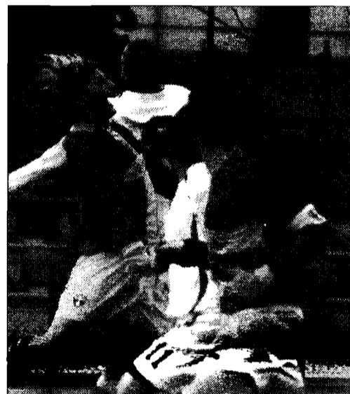
Pino Svetica Il roccioso difensore rossoblù Colantonio del Valfabbrica stacca appena fuori dall'area