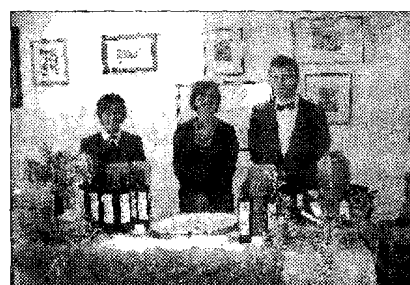
Allestimento che fa "scuola"

L'iniziativa per l'istituto Alberghiero è stata coordinata, anche quest'anno, dal