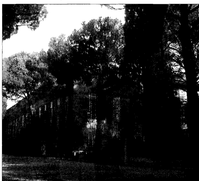
Ex Deltafina L'area al centro delle polemiche

Il primo cittadino non è solito ad entrare nel circolo vizioso di dichiarazioni e smentite, "ma questa volta vorrei smorzare questo clima di antagonismo e estremismo politico". La variante Deltafina per il sindaco rimane indiscutibilmente la scelta migliore che l'amministrazione potesse compiere tra la trascuratezza attuale dell'area e l'ipotesi di un miglioramento oggettivo. "Riusciremo a salvare il verde, recuperare un sito industriale, accorpate i servizi socio-sanitari e promuovere un commercio