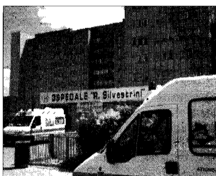
Ex Silvestrini La donna è ricoverata

Secondo alcuni testimoni presenti sul luogo dell'incidente, la mancanza di illuminazione nel punto in cui attraversava la giovane e il fatto che fosse vestita completamente di nero