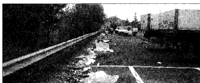
Denunciati problemi di igiene nella zona industriale