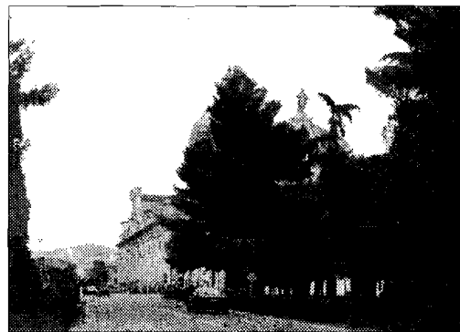
Centro Il fatto è avvenuto a pochi passi dalla basilica

china. Teatro del triste episodio, come ormai purtroppo è quasi consuetudine, il centro della frazione di Santa Maria degli Angeli, dove già più volte si sono verificate situazioni analoghe; spesso alcuni avventori di locali situati a pochi passi dalla basilica, non di rado sotto l'effetto di sostanze alcoliche, si sono acciampati tra di loro in pubblico, richiedendo un intervento deciso delle forze dell'ordine. Circostanza che si è ripetuta anche mercoledì sera, quando, poco dopo le 21, si è consumata la rissa finita a bottigliate.