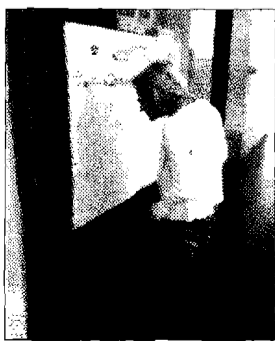
Alle urne Anche oggi