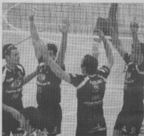
Festa Sir Bastia esulta per un grande primato