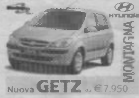
Nuova GETZ € 7.950