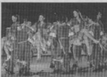
Più forti di tutti La Salsaloca in azione ai campionati del mondo di Bassano del Grappa