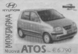
Nuova ATOS € 6.790