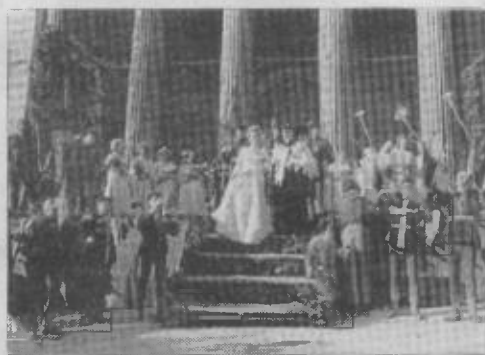
Calendimaggio Una bella immagine della festa