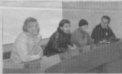
Miceli Ha tenuto la conferenza stampa

I giocatori rossoverdi revocano il silenzio stampa La Ternana ritrova la parola