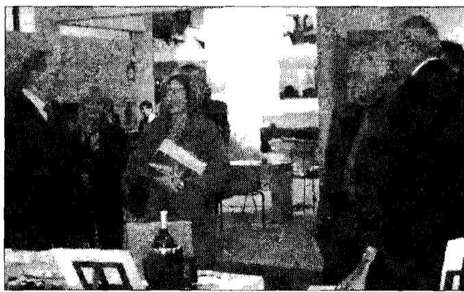
Vitae La rassegna è allestita al centro fiere di Bastia Umbra

ASSISI - Oggi la seconda giornata di Vitae, prima rassegna sul benessere che sponsorizza la qualità del tempo libero. E' stata Maria Rita Lorenzetti, accompagnata dal rullo di tamburi degli Sbandieratori di Assisi, a tagliare il nastro della rassegna, che si tiene al Centro Fieristico di Bastia Umbra fino a domenica 28. A seguire il presidente della regione c'erano tutti i rappresentanti degli enti che hanno fortemente voluto la rassegna, l'agenzia Enit e l'Apt umbro, nonché le autorità politiche locali. Unanime il plauso all'iniziativa che coinvolge 11 regioni italiane, 150 espositori e 150 enti che parteciperanno agli incontri locati nell'area work shop. Il fine è quello di comunicare la preziosità e le potenzialità importanti di un nuovo turismo, che si sviluppa appagando le esigenze