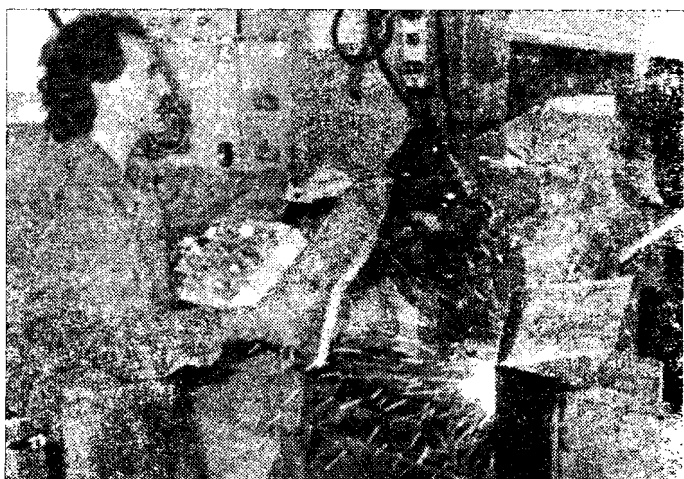
Meccanica Per la Franchi un progetto pubblico-provato