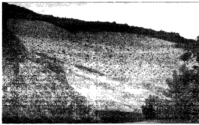
Frana Ancora al lavoro per una soluzione definitiva

ASSISI - Il progetto per la risoluzione delle frana di Torgiovannetto, avallato dal comitato interistituzionale, non riceve in prima battuta il parere completamente positivo della Soprintendenza. L'ente ha infatti posto alcune problematiche in merito al progetto avallato dal comitato interistituzionale di cui fanno parte Regione Provinciale e Comune e Comunità montana.