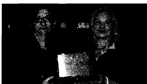
Premiazione La targa consegnata all'insegnante della scuola primaria Masi

ASSISI - E' andato alla scuola primaria Masi di Petrignano, dell'istituto comprensivo Assisi 3, il Label Europeo per la promozione delle lingue. Il riconoscimento ha premiato il progetto intitolato "More English, more computer science"; gli alunni della scuola primaria di Petrignano useranno programmi di videoscrittura e dizionario digitale per commentare gli avvenimenti di maggior rilievo della scuola.