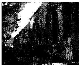
Dibattito Sulla riqualificazione