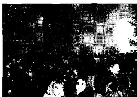
Capodanno Festeggiamenti bastioi

BASTIA UMBRA (v.a.) - Niente permesso per la struttura comunale; la festa di Capodanno si sposta al pub. Per quest'anno la grande festa organizzata nella struttura comunale di Bastia non si potrà fare secondo i canoni a cui ci si era abituati. L'appuntamento è divenuto negli ultimi anni una piacevole alternativa alla tradizionale notte di San Silvestro in discoteca, coinvolgente e alla portata di tutti, ormai irrinunciabile per molti giovani, umbri e non. Purtroppo, però, il prossimo 31 dicembre la festa non si svolgerà nella sede usuale, una struttura comunale data in uso per le passate edizioni. Malgrado le richieste, infatti, quest'anno non è arrivato alcun permesso di utilizzo. Nonostante ciò la festa si farà, benché ridimensionata, grazie alla disponibilità del