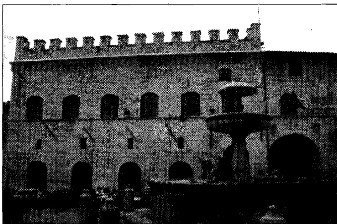
Comune La sede del palazzo assisiato

per attività connesse alla ricostruzione), con l'obiettivo di formare una graduatoria degli idonei, secondo cui attribuire i posti messi a concorso e poi "attingere" per le successive assunzioni. Pomo della discordia alcuni punti del bando, che secondo il Tar sono stati attuati "in modo difforme". Innanzi tutto, mentre nel bando si prevedeva una prova scritta costituita da un "quesito o quesiti" su alcuni argomenti, i partecipanti al concorso hanno svolto un "tema"; una differenza che, secondo il giudice, "non è nominalistica, ma attiene al contenuto e alle modalità di svolgimento della prova, e ha un riflesso diretto nel tipo di valutazione - e di selezione - che ne consegue"; infatti, mentre la valutazione di risposte a quesiti è "tendenzialmente oggettiva", riducendo