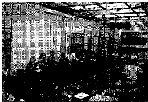
L'assemblea La sala del consiglio comunale gremita

zione, che dalle affermazioni inoltrate sembra essere tacciata di mancato coinvolgimento popolare? Sta di fatto che in seguito all'elezione, il direttivo è passato alla