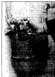
Polemiche sul servizio

Insufficienti le garanzie per il futuro dell'azienda