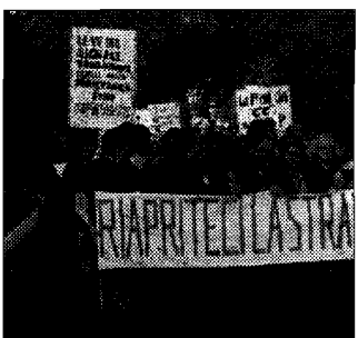
Battaglia Per riaprire la

ASSISI - Dopo la manifestazione di novembre, i tavoli e le comunicazioni degli ultimi mesi, il Comitato di Torgiovanetto promette fuoco e fiamme a seguito della mancata risoluzione dei problemi della frana che si trascina ormai da quattro anni. "Le dieci bugie sulla frana di Torgiovanetto"; questo il titolo della conferenza stampa che il Comitato organizza martedì nella Sala Blu de! Comune, alle 10.30. In programma: un