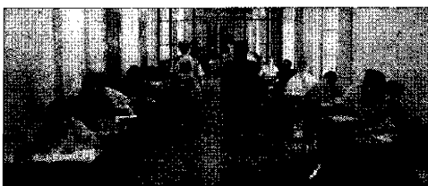
Maturità Bene gli studenti dell'istituto alberghiero