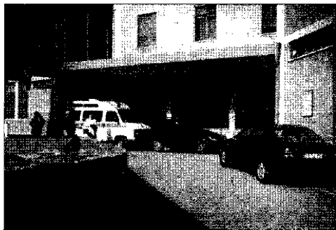
L'ospedale L'ingresso del presidio sanitario assisano