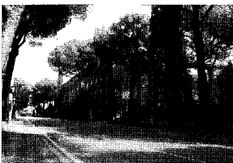
Ex Deltafina Dibattito aperto sul futuro

volumetrici e destinazioni urbanistiche restano invariate". Su questo l'amministrazione sembra confermare. 7.500 sono infatti i metri quadrati senza possibilità di riconversioni; questo l'ultimo responso dato dal sindaco Francesco Lombardi durante l'assemblea pubblica monotematica sull'area ex Deltafina. Si è ristretto quindi di 500 metri il progetto che inizialmente prevedeva 8.000 metri, e che va ricavato in diverse zone, destinabili al commercio. L'amministrazione assicura che sulla zona in oggetto verrà ancora ampiamente discusso con la cittadinanza. La prima parte di questo dibattito c'è stata venerdì sera; i cittadini bastioli hanno avanzato le proprie istanze relative alle nuove esigenze in materia di viabilità, ma sono