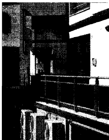
Giudice di pace Importanti sentenze