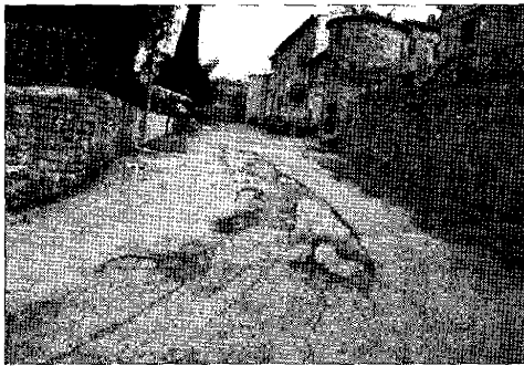
Particolare il tratto tra Tordibetto e Beviglie

Il terzo problema rilevato dal consigliere è relativo al tratto di strada