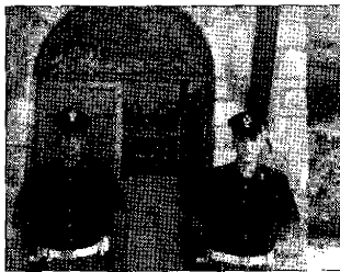
Commissariato Quello attuale