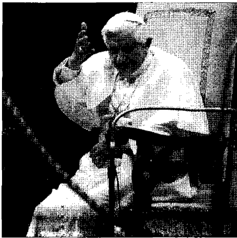
Cresce l'attesa Per la visita di domenica

ASSISI - Si contano le ore all'arrivo di Benedetto XVI e si fanno le stime dei giovani che parteciperanno all'evento; ottomila sono le presenze previste per domenica pomeriggio alla cerimonia che si svolgerà di fronte alla Basilica di Santa Maria degli Angeli. Il palco è già in fase di montaggio inoltrato. I giardini sono stati sistemati, il cantiere Donnini coperto da un apposito pannello; insomma, tutto è pronto. Esattamente alle 17.30 il Papa lascerà Assisi per raggiungere la terra della Porziuncola, passando per l'Istituto Serafico, dove saranno in attesa i giovani ospiti della struttura; alle 17.45 è previsto l'arrivo nella piazza di Santa Maria degli Angeli. Papa Ratzinger attraverserà lo slargo salutandoli i giovani presenti e farà poi l'ingresso nella Basilica; lì si svolgerà una visita privata della Porziuncola, durante il quale il Pontefice si racconterà in preghiera. Alle 18 si darà il via al grande momento di comunione festosa con gli ottomila giovani. Due porteranno personalmente i