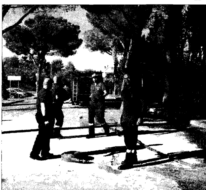
Vigili del Fuoco Sono intervenuti sul luogo dell'incidente

Ancora da chiarire la dinamica dello scontro che ha causato lesioni e traumi alla donna. Pare che alla base della collisione con un'altra vettura, proveniente da un braccio della rotatoria, sia stato il mancato rispetto della precedenza nei confronti dell'auto che si era già immessa. L'impatto tra le vetture ha causato il ribaltamento della Ford Fiesta con all'interno l'anziana donna. L'altra vettura ha riportato danni, ma la persona che si trovava alla guida non è rimasta