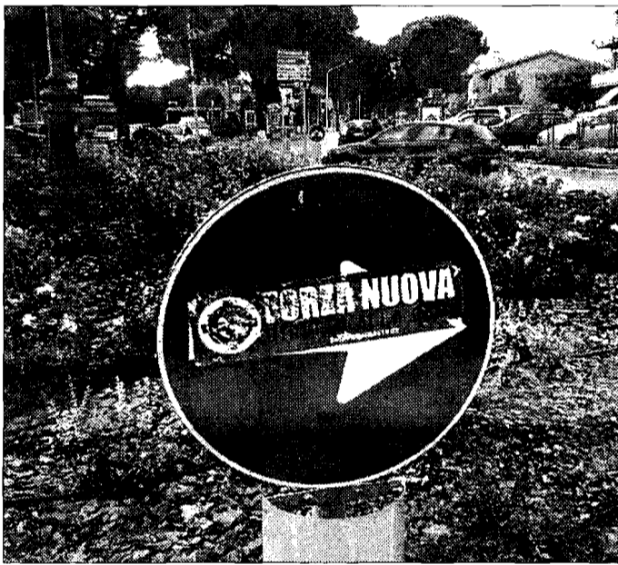
Scritte e adesivi I cittadini non hanno gradito l'invasione