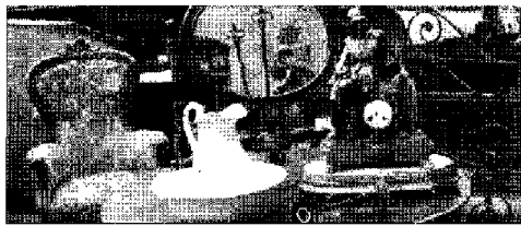
Antiquariato Tornano i buoni affari e le curiosità