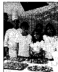
Cucina Tutti insieme