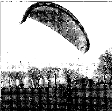
Parapendio L'ebbrezza del volo libero

Al termine gli allievi saranno sottoposti ad esami da parte di un esaminatore dell'Aero Club d'Italia conseguendo così il brevetto di pilota per il volo da diporto o sportivo. Il costo del corso sarà ridotto al fine di far avvicinare i giovani e i meno giovani al mondo del volo libero. Per rassicurare chi si vuole avvicinare al volo libero in parapendio si da un breve cenno dell'attività e dell'attrezzatura il parapendio è un'ala morbida simile al paracadute, la porta a posizione