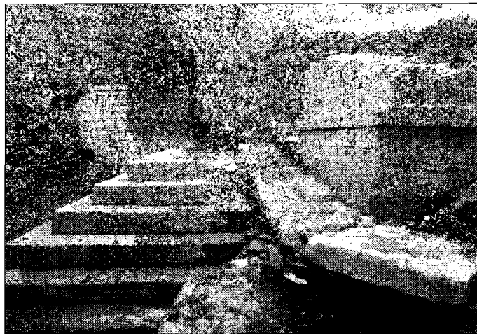
Resti archeologici In città scavi e ritrovamenti importanti

mento del foro romano sotto la piazza del Comune, mentre è già stato completato il cunicolo romano nell'ambito degli interventi per il percorso meccanizzato di San Rufino. Attraverso questo sarà possibile percorrere mille anni in pochi metri, percorrendo in poco tempo tratti panoramici, mura medievali e antichi sistemi di raccolta acque. Ovviamente sto parlando di interventi tutti molto a cuore all'amministrazione comunale". L'area interessata allo scavo di recente scoperta si estende sotto l'edificio dell'ex convento di Santa Caterina, alle spalle della omonima chiesa; questi spazi sono accessibili da un vano seminterrato che si affaccia su piazza Matteotti. L'area, sottoposta a vincolo archeologico già dagli inizi del '900, è stata finalmente scavata