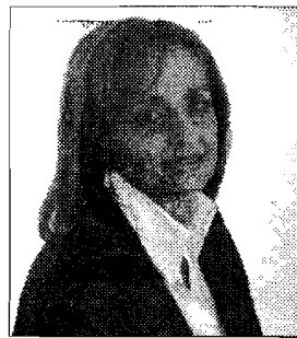
Al centro della polemica gli asili nido