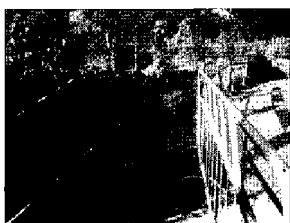
Muro pericolante Zona transennata

ASSISI (v.a.) - Muro pericolante in zona ponte Santa Croce. La segnalazione è partita da alcuni cittadini, che hanno avvisato vigili urbani e vigili del fuoco rendendosi conto di un improvviso cedimento del parapetto di mattoni che dovrebbe garantire la sicurezza del ponte. La struttura sembra invece pericolosamente a rischio, come dimostrano i mattoni che si sono staccati dalla costruzione e la pendenza anomala che l'intero parapetto sembra aver assunto. Ecco allora che i vigili hanno disposto il posizionamento di alcune transenne e