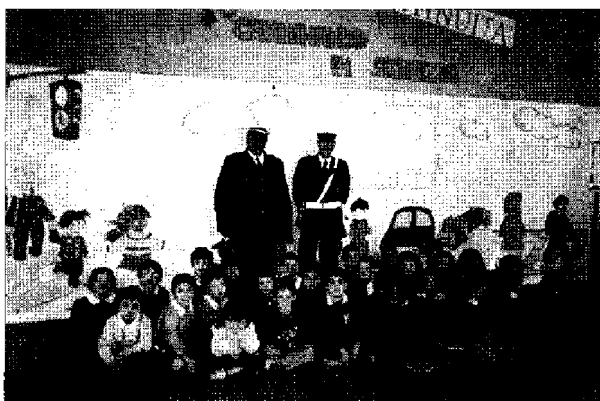
Applausi I piccoli studenti bastioli hanno tenuto alto il nome della città in campo nazionale

BASTIA UMBRA - Settimo posto per la classe II A della scuola elementare di Ospedalicchio nel concorso nazionale Pignascuola 2006. Gli alunni dell'istituto della frazione bastioli hanno partecipato al concorso sul tema della sicurezza stradale.