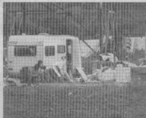
Non ai campi nomadi Mozione di Forza Italia