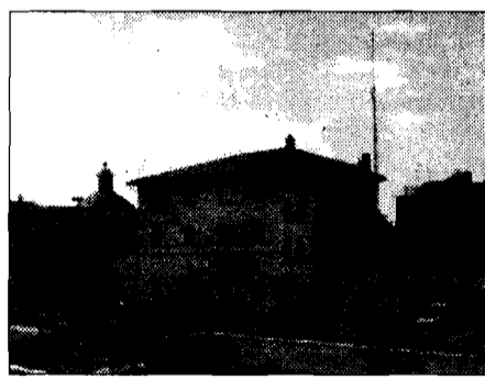
Assisi La caserma dei carabinieri