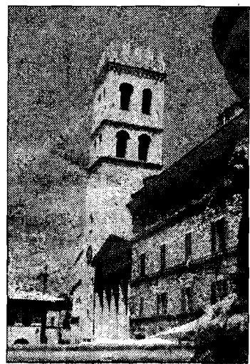
In Comune Diatriba

posti disponibili per accogliere i bambini non dipende da una scelta locale, ma da un regolamento regionale che va applicato in sede municipale per cui può essere ospitato un solo bambino per ogni 9,5 metri quadri. Una soglia molto più alta di quella di altre regioni, che permette di tenere un numero inferiore di bambini per ogni struttura. Insomma, il problema della carenza di posti andrebbe esposto in altre sedi".