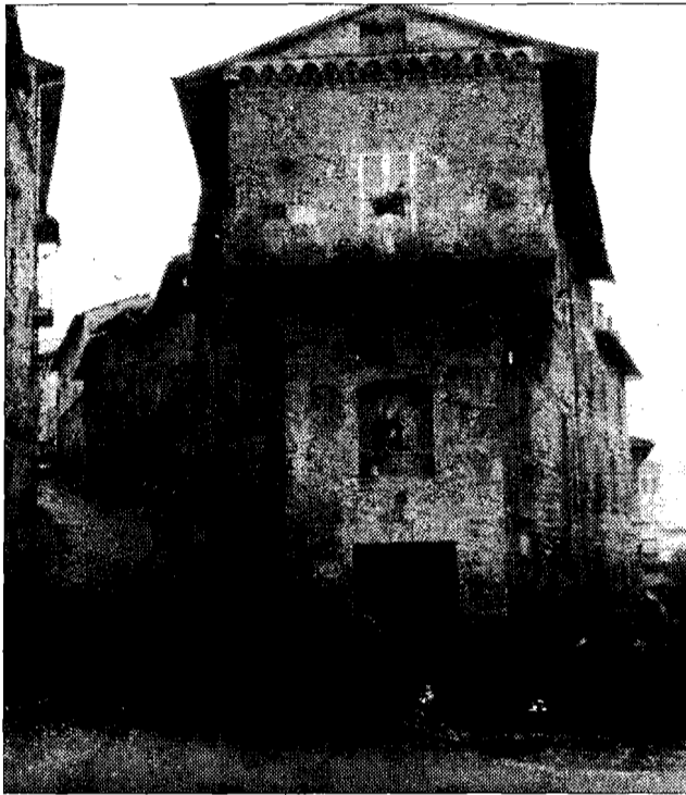
Assisi. Le tante salite in città creano disagi ai disabili