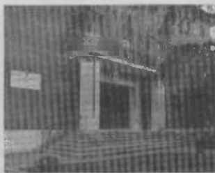
Varianti Varate dal consiglio

BASTIA UMBRA - Si è parlato anche di Agriumbria nel corso dell'ultima seduta consiliare. Il sindaco ha evidenziato l'importante traguardo raggiunto dalla manifestazione che ha registrato oltre 60mila presenze. L'amministrazione quest'anno ha investito importanti risorse per l'adeguamento, la ristrutturazione e la manutenzione di elementi fisici legati alla demolizione e ristrutturazione dell'area dell'ex mattatoio. Il Comune ha erogato sia in risorse proprie sia in cofinanziamento due milioni e mezzo di euro. Attualmente è in corso l'appalto per le pensiline e l'adeguamento del centro congressi per l'armontare complessivo di 685mila euro. C'è anche il progetto esecutivo per circa 750mila euro per l'abbattimento del mattatoio, la riqualificazione dell'area circostante e l'ampliamento del centro