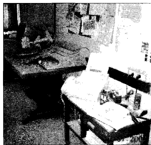
Danni e disordine L'incontro con la polizia e la scuola dopo il passaggio dei baby vandali

Non è chiaro se i due minorenni frequentassero gli istituti interessati. Sull'identità dei due la polizia non ha infatti fornito alcuna indicazione, proprio perché si tratta di minori. Perché si sarebbero trasformati in vandali? Per "divertimento": questa sarebbe stata la loro risposta. Tra l'altro non ci si trova di fronte