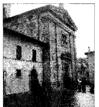
Nuova chiesa Alcuni momenti dell'inaugurazione