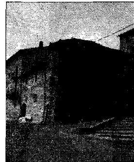
Si parlerà di Tordibetto