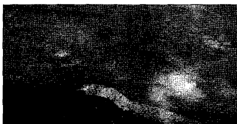
In bell'evidenza Gobbe e dossi nel manto stradale

BASTIA UMBRA - Strade dissestate. L'allarme i cittadini lo lanciano a partire da viale Giontella, dove da tempo non vengono riqualificati marciapiedi e annessi. Ma la soluzione viene prima ancora che l'amministrazione risponda ed è collegata ad uno dei temi più scottanti e dibattuti nelle ultime settimane: il progetto per l'area ex Deltafina. E' noto infatti a tutti che, a meno che le attività organizzate dai due comitati avversi al progetto, il Comune provvederà presto alla realizzazione di tre rotonde che interessano l'area e quindi conseguentemente alla riqualificazione di tutta la viabilità. Tutto risolto insomma, se non fosse che il problema non è limitato a un solo viale o a un'area urbana; polemiche a parte infatti marciapiedi sconnessi, crepe di asfalti e dossi conseguenti sono disseminati un po' ovunque per le strade del centro commerciale bastiolo. Nessuno vuole credere che si tratti di incuria da parte dell'amministrazione, che proprio recente-