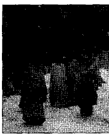
Nobili parti Via per l'estate

ASSISI - Il Calendimaggio va in trasferta. Sarà un agosto pieno di impegni quello che si accingono a trascorrere i partaioli della Parte de Sopra e della Parte de Sotto del Calendimaggio. Mentre la Magnifica sarà impegnata nella tradizionale uscita di Priverno, in provincia di Latina, la Nobilissima apprenderà per la prima volta all'isola d'Elba. Le uscite saranno un'occasione, come tradizione ormai da più di un decennio, per "esportare" spettacoli di intrattenimento per il pubblico e "know how" del Calendimaggio, in cambio di fondi utili alle casse delle Parti per lo svolgimento della festa di maggio. Prima a partire sarà la parte rosa, che resterà a Priverno dall'11 al 13 agosto. "Ormai da anni curiamo l'allestimento della manifestazione nel borgo dell'abbazia cister-