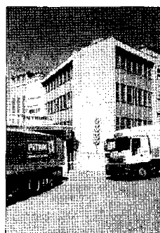
Lo stabilimento Petri