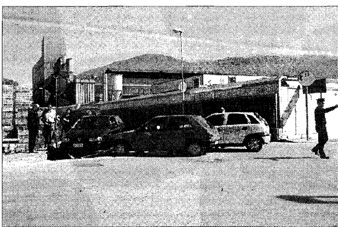
Incidente Tre auto si sono scontrate, illesi i conducenti

ASSISI - Ennesimo incidente lungo la strada che dall'industria Tacconi conduce verso Castelnuovo. Stavolta a scontrarsi sono state tre vetture provenienti da differenti sensi di marcia, probabilmente a causa di qualche problema nel dare precedenza. Nonostante i conducenti non abbiano riportato danni, l'incidente conferma la pericolosità di uno svincolo spesso teatro di scontri anche gravi. Un problema che dovrebbe essere risolto con la realizzazione del sottopassaggio Anas, anche se sicuramente non in tempi brevi.