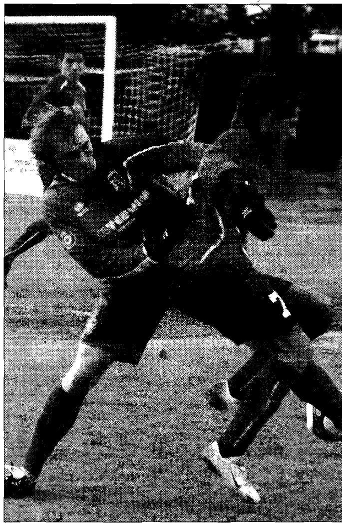
Lo scontro Berdini cerca di fermare il bastiolo Battistelli

Ventaglio offensivo spiegato, con le quattro punte tutte in piedi, mediana Fornetti-Farinelli ormai certezza anche a marce ridotte. Difesa poco o nulla impegnata ma solida come un acquedotto romano. Sbadati i biancorossi, peccati di gioventù, ma belli davvero ad inizio ripresa, veloci ed entusiasmati, di breve vita però, come una goletta intercettata da un incrociatore. Belckachack sembra sempre sul punto di regalare perle ma è un vulcano che brontola soltanto,