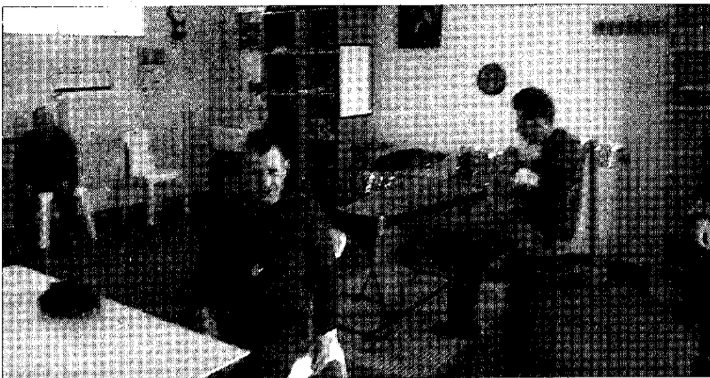
Gli ospiti del Centro Sereni al lavoro: stasera una mostra mercato dei loro prodotti