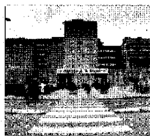
In ospedale All'ex Silvestrini