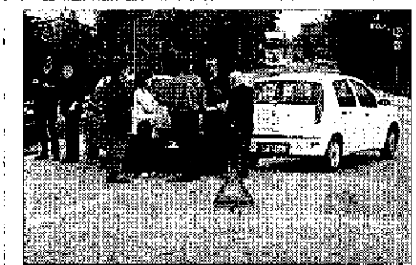
Ancora un sinistro Stavolta per fortuna nessun ferito