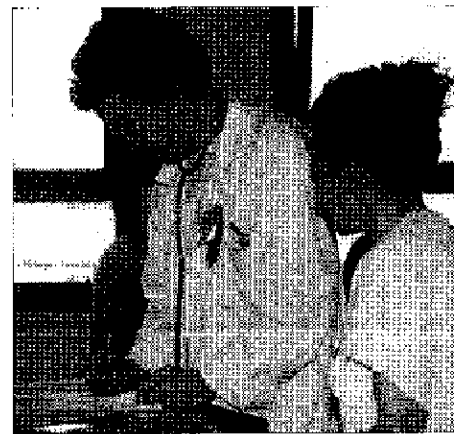
Infezione rara. Medici impotenti

Il decesso, che ha sconvolto la famiglia dell'uomo, è arrivato nonostante le cure mediche che però non hanno mai dato spazio a speranze. Abbiamo rivolto alcune domande ad alcuni medici di base su questa malattia. "È un batterio che quando si manifesta difficilmente lascia speranze. La legionella penetra nell'ospite attraverso le mucose delle prime vie respiratorie, in seguito a inalazione di aerosol contaminati o di particelle di polvere da essi derivate o aspirazione di acqua contaminata. Una volta penetrata nell'organismo i batteri raggiungono i polmoni dove vengono fagocitati da macrofagi alveolari, che però non sono in grado di ucciderli o di inibirne la crescita. La malattia dei legionari è la forma più severa dell'infezione, con una letalità media del 10%, che può arrivare anche al 30-