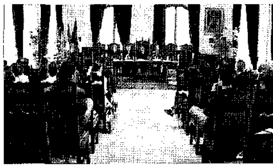
In Comune L'inaugurazione nella sala della conciliazione