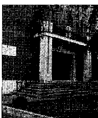
Il palazzo comunale di Bastia