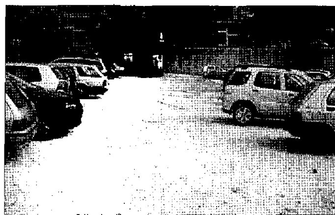
Un parcheggio troppo scomodo L'area per la sosta delle auto fuori dall'ospedale di Assisi e nell'area dentro le sbarre

ASSISI - Non sarà una novità, ma all'ospedale di Assisi i parcheggi sono un problema. Un argomento da rimettere in discussione. Troppo affollati i posti macchina che si trovano all'interno delle sbarre di ingresso, mentre per ciò che riguarda l'area esterna adibita ad accogliere i veicoli degli utenti, le immagini parlano chiaro. Polvere nelle giornate di sole e fanghiglia quando piove; le buche sono una costante. Il problema coinvolge un po' tutti, non solo i ricoverati ed i loro parenti. Anzi a subire costantemente disagi è soprattutto il personale medico e paramedico. I veicoli temporaneamente abbandonati, anche se per brevi soste ma in posizioni bizzarre, ostacolano spesso le mano-