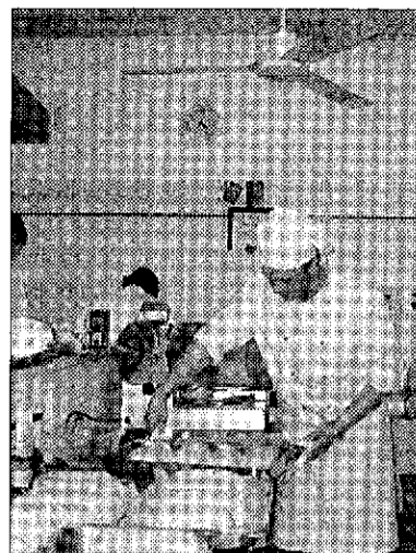
Stavolta, protagonista sarà il liceo "Properzio" con il progetto "Fontane di Assisi, un percorso di millen-