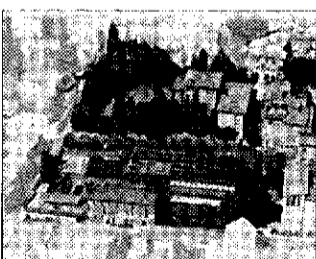
La sede della Pro Civitate