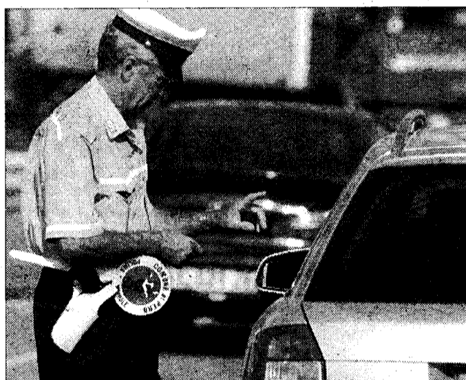
Assisi presa d'assalto In estate dalle auto dei turisti

ASSISI - L'augurio, quando ci si avvicina alla propria macchina, è sempre lo stesso, che quel foglietto ancorato al tergicristallo che sporge dal parabrezza contenga solamente pubblicità. E ci si appropinqua a dita incrociate. Spesso, però, almeno in quest'ultimo periodo, la spiacevole sorpresa è quella di trovarsi a dover pagare circa trenta euro per divieto di transito e di sosta. Sembra che, effettivamente, nel periodo estivo aumentino i controlli e il numero di sanzioni per coloro i quali si avventurano in parcheggi a dir poco ardui e ingressi fuori orario nella zona a traffico limitato. Controlli e sanzioni sono giusti, ci mancherebbe altro. C'è chi si chiede però il motivo per il quale nella bassa stagione sia possibile parcheggiare addirittura in piena piazza municipale, mentre in estate c'è minore elasticità. Il problema, a questo punto, è comprendere se ci siano effettivamente degli incrementi "ciclici", e quali siano le eventuali motiva-