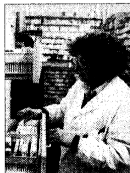
Farmacie In sciopero