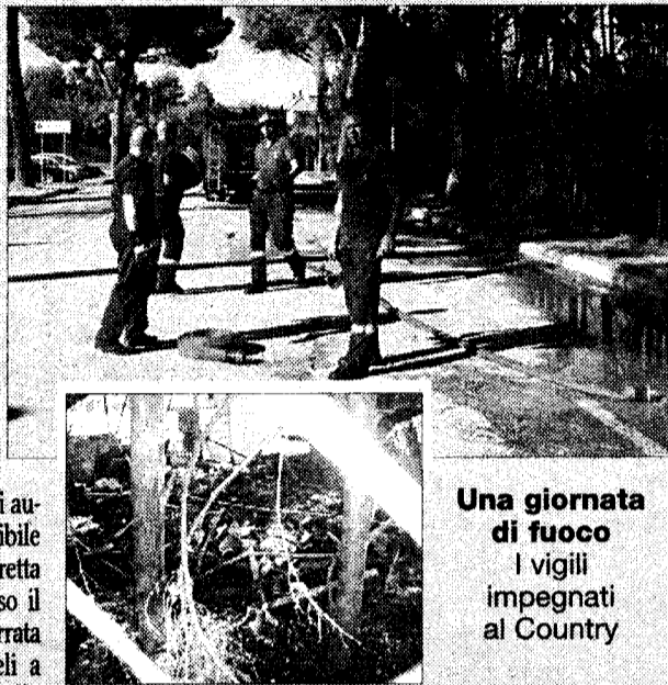
Una giornata di fuoco. I vigili impegnati al Country

ASSISI - Una lunga giornata, quella di ieri, per i Vigili del fuoco di Assisi. Diversi roghi hanno, infatti, interessato, durante il pomeriggio, il comprensorio, e non solo, seminando il panico tra la cittadinanza. Tra le fiamme anche il giardino che circonda il locale Country di Bastia Umbra. Per più di un'ora i pompieri della città serafica hanno lavorato per sedare il fuoco che ha inghiottito anche buona parte della mobilia esterna. Sul posto sono intervenuti anche polizia municipale e carabinieri, per accertare le cause dell'incendio. Le forze dell'ordine parlano di autocombustione delle sterpaglie attribuite al forte caldo o ad una cicca di sigaretta non spenta. Per il momento è escluso il dolo. Poco distante, lungo la strada ferrata che collega Santa Maria degli Angeli a Cannara, all'altezza del passaggio a livello numero 12, le fiamme hanno spazzato via le stoppie lungo il fossato. Stesso scenario in via Cipresso, lungo la Torgianese. Nei pressi di Bet-