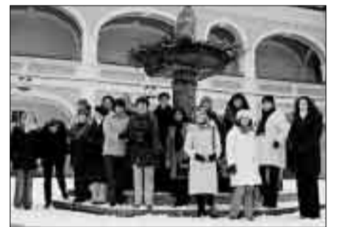
Foto di gruppo durante la gita